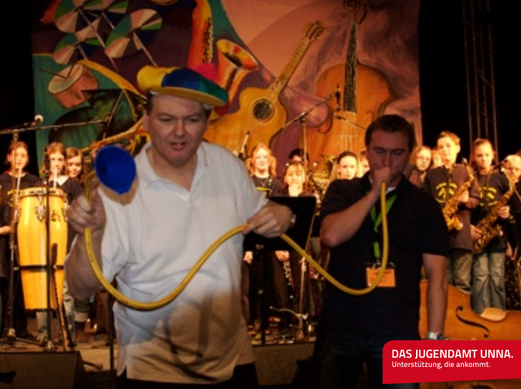
DAS JUGENDAMT UNNA. Unterstützung, die ankommt.